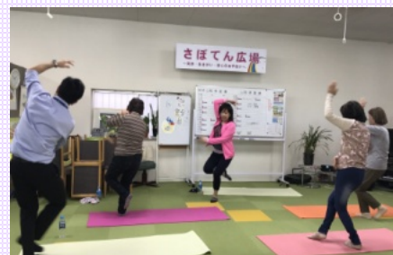
9月から歌謡ダンスが新しい曲に変わりますよ